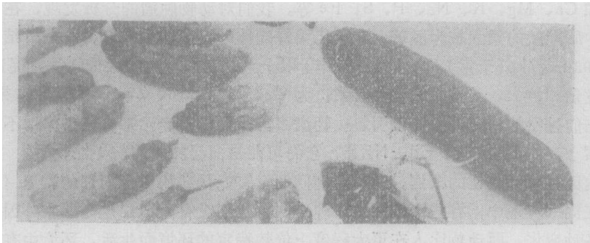
照片三 正常黄瓜与瘤状黄瓜

瘤状黄瓜在普通生物显微镜下,胚胎中胎座不发育,分窠不明,胚珠种子不发育,表皮栅状细胞畸短畸长,厚薄不一。电子显微照片看到,整个细胞各部分全面变异,线粒体、内质网解体,以至完全破坏,质体(包括叶绿体等)显著破坏(叶绿素、叶黄素分离液的吸收光谱曲线也和正常黄瓜不同),在细胞中出现较多的凝聚、絮结、团块等现象,细胞中除液泡增多外,还有大量的嗜碱性金属凝聚颗粒(照片4)。这些颗粒已为光谱分析证实是金属、重金属物质。并且已查明这些有毒物质的来源。