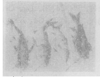
照片二 杆枝所指下唇伸长 (鱸魚)

环境污染引起植物畸变,可以发生在根、茎、叶、花和果实各部位。番薯( Ipomoea reptans )在含镉污水中的畸变表现为茎、叶的过度生长。黄瓜( Cucumis sativus )瘤状畸变是值得重视的一种现象。畸变黄瓜的瓜藤生长缓慢,茎小而短,叶小而薄,花小,果小,瓜果全为肿瘤状突起(照片3)。