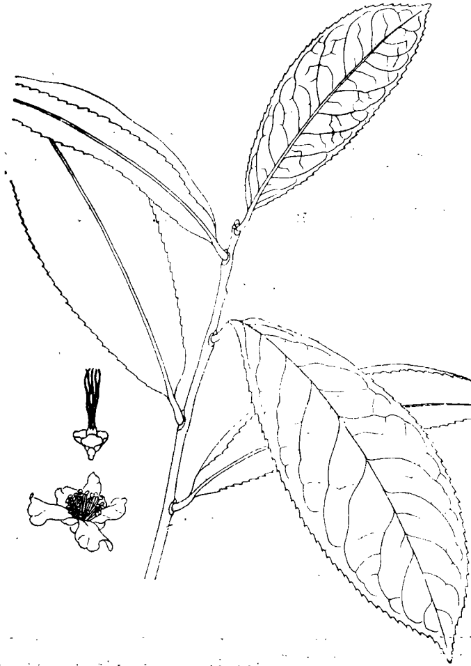
图 2 - 五室金花茶

越南：谅山省，友盆县，Bai lar，中越考察队1599(模式，存中山大学标本室)。和金花茶非常接近，只是后者花大，花梗较长，小苞片 5~8，萼片较大。