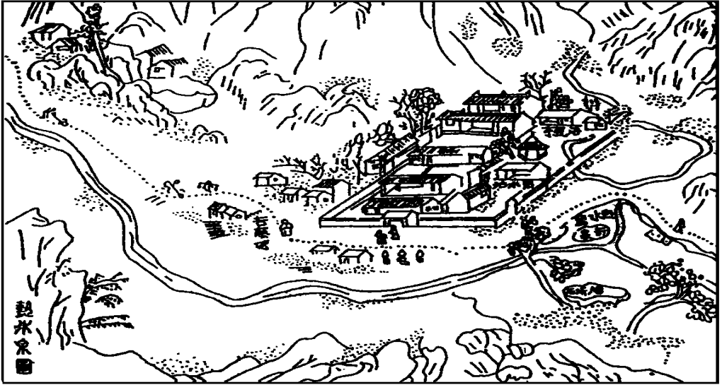
图 1 明清时期热水温泉盛况鸟瞰图

Fig. 1 Bird's-eye view of the grand occasion of the hot spring during the Ming and Qing Dynasty 不。风景区内摩崖石刻更是比比皆是。如位于 234 m 高的银萝岭上，一块面如刀削、凌空矗立于危崖处的巨石上刻有“山水可人”四个大字，字体苍劲有力，字径均为 2.64 m 之高，此为清朝康熙年季燕状元霍维鼎所题（见图 2）。